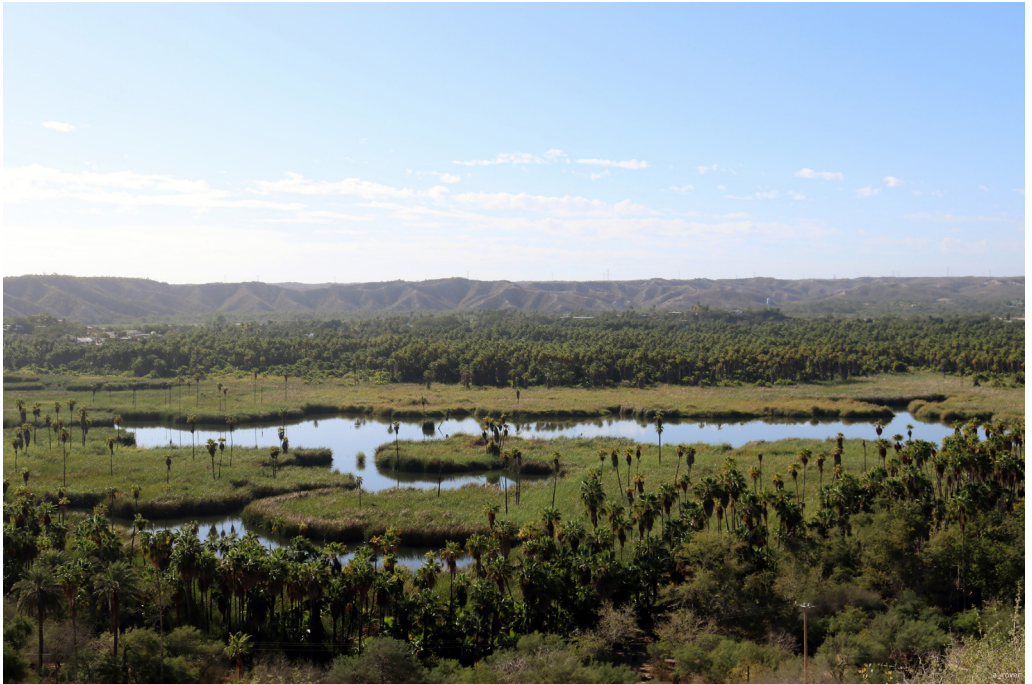
Oasis de Santiago