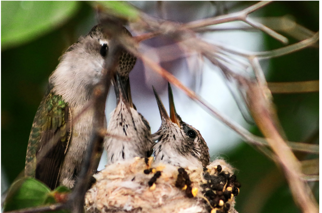
Colibríes en un patio de La Paz