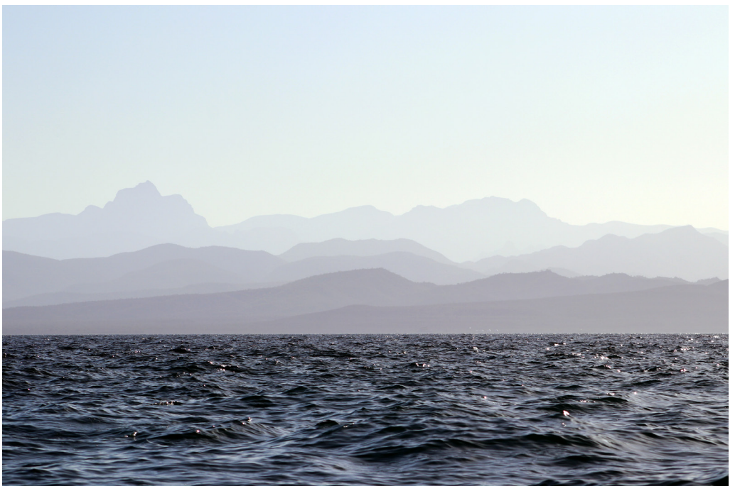
La costa de Loreto.