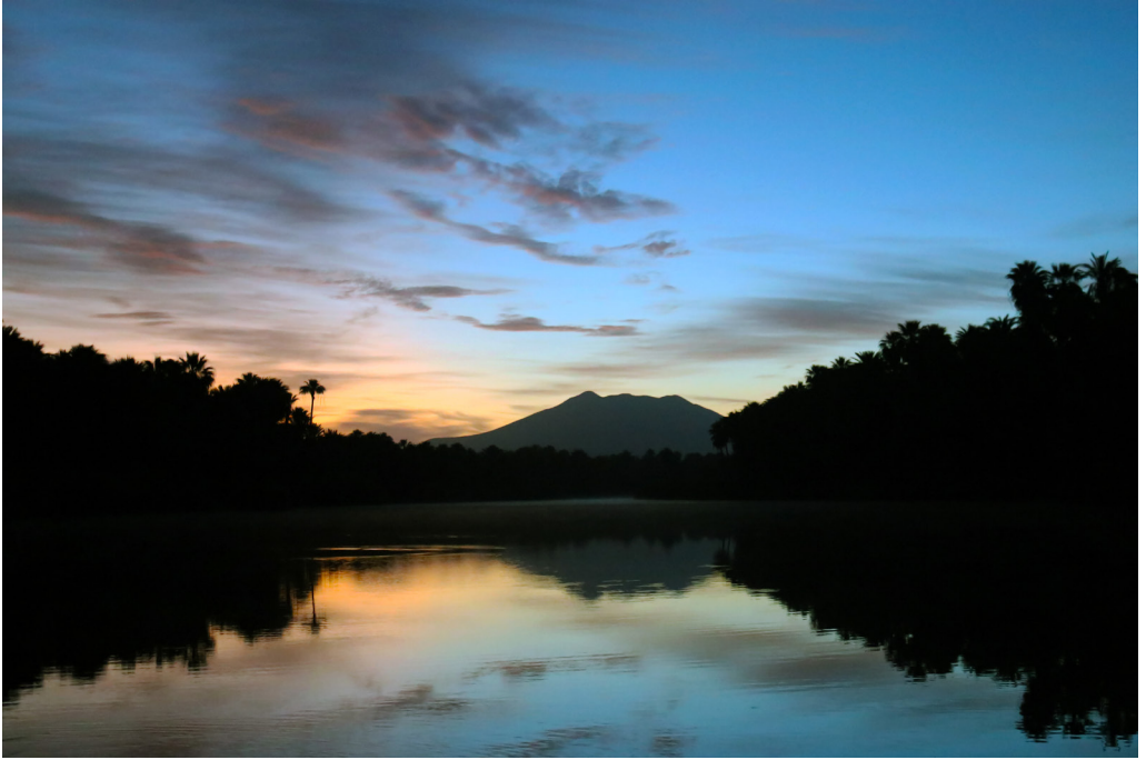
Amanece en San Ignacio Kadakaamán.