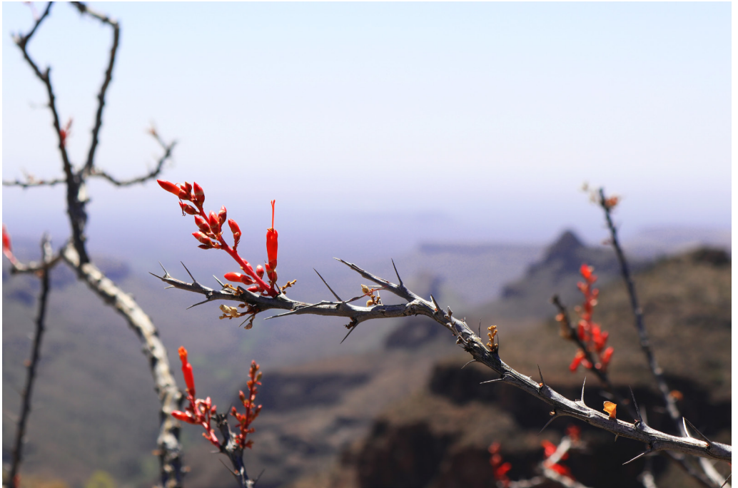
Flores del desierto