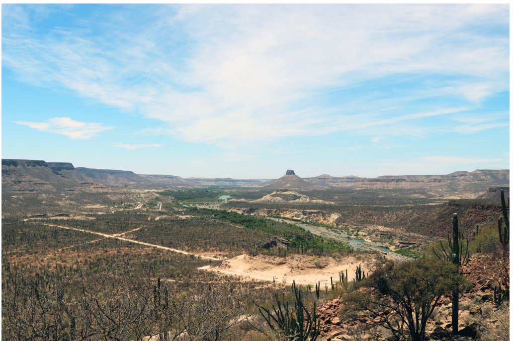
Cerro de El Pílon, camino hacia La Purísima