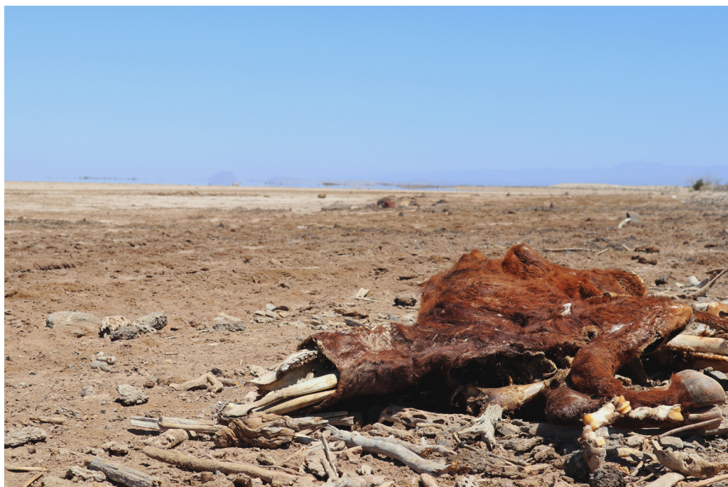
Salar de la Laguna de San Ignacio