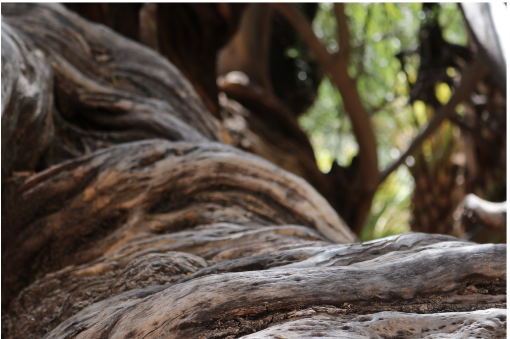
Olivo tricentenario de San Javier.