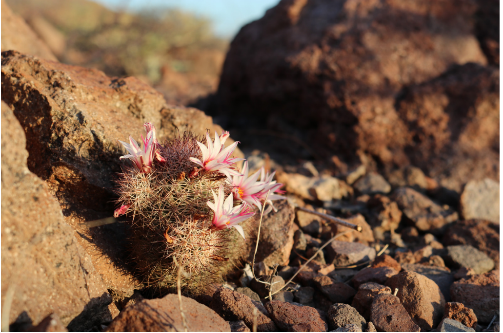
Cactus en el sendero del cerro de Balandra.