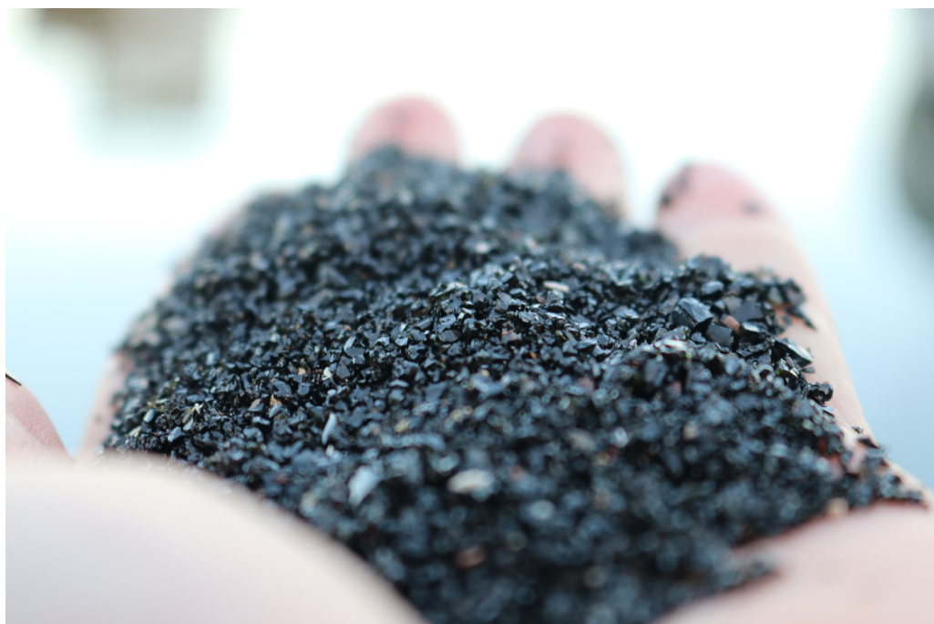
Arena escoria en la playa de Santa Rosalía